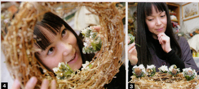
3 リースの下の部分から配置し、徐々に上方へ飾りつけていくのが上手につくるコツ。4 たまに全体像をチェック。「形になってきた」と興奮気味のレポーター。

鮮やかなグリーンをリースの土台に接着 していきます。開始早々、どこに配置す ればいいのか戸惑う私にアドバイスが。 「立体感を出すために、リースの下の部 分や奥行きも忘れずに緑を差し込んでみ てくださいね。あと、全体の幅が均一に なるよう、たまにちよっと離れて眺めて みるとういことです」 アドバイスに従って差し込んでいくと こんもりと盛り上がったシルエツトが完 成！次は飾りの木の実や光沢のあるボ ールの配置です。夢中になっている私に 「もっとランダムに飾りつけてみていい ですよ」と、さらなるアドバイス。確 かに不規則に配置しただけで、いつぞう プロフェッショナルな仕上がりに！ 一見、とても複雑に見えるクリスマス リース。でも、トライしてみると基本的 には材料を接着していくだけの簡単作業 (センスは問われませんが…)。もちろん先