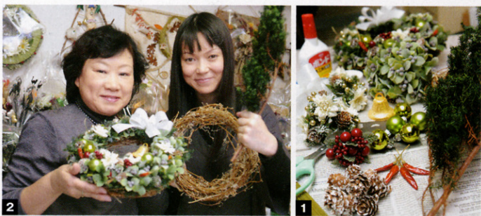
1 用意されているのは、天然の木の小枝でできたリースの土台、装飾品のほか、木工用接着剤、はさみ。そして見本となる先生の作品。2 先生がつくったリースのお手本を前に、レポーターも気合充分！

クリスマスに欠かせないものといえば ケーキにプレゼントに…、そうリース！ 今年は手づくりリースにチャレンジです！